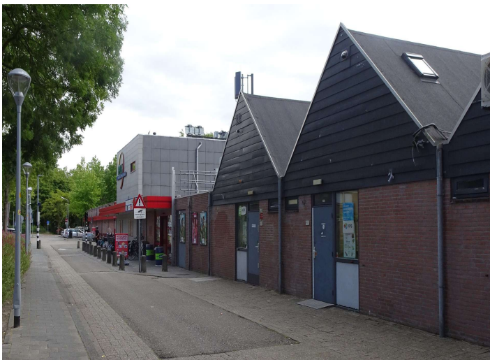
het huidige winkelcentrum in Pax

Voor de bouw van het complex is een wijziging van het bestemmingsplan vereist. Dit kan de planning vertragen, omdat de gemeenteraad er nog een besluit over moet nemen en er bezwaren kunnen worden aangetekend.