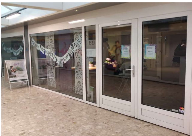
Hoorbegrip in Pax