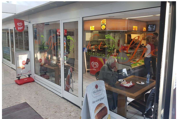
de "oude" snackbar "het Elfje in Pax

Hoorne Vastgoed is om een reactie gevraagd maar het bedrijf heeft hierop niet gereageerd.