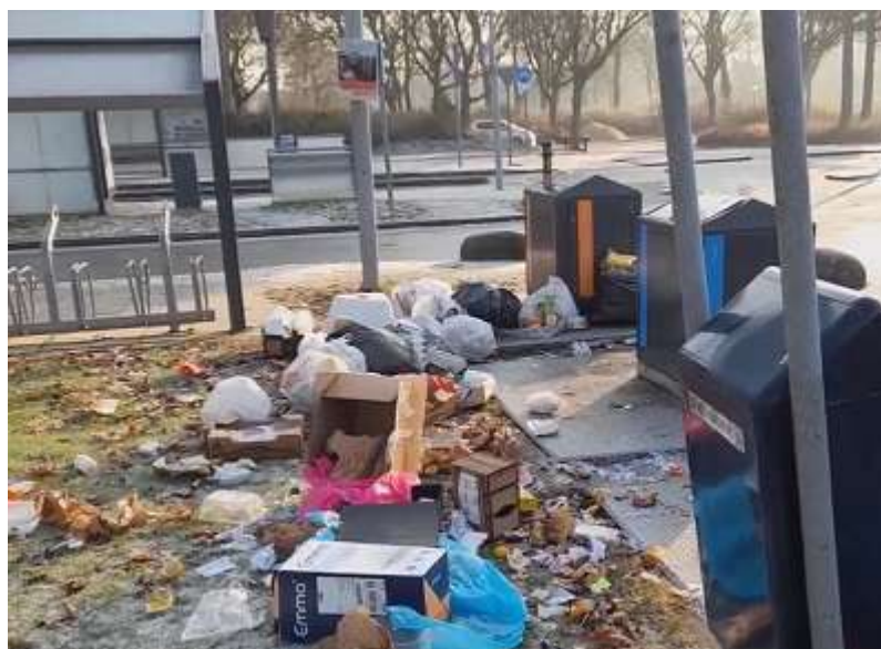
Vervuiling bij winkelcentrum Pax

Houd Pax opgeruimd en schoon, ook in eigen belang!