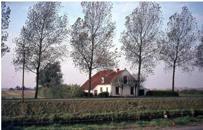
DE WITTE BOERDERIJ, DAARACHTER DE CEBECO BOERDERIJ