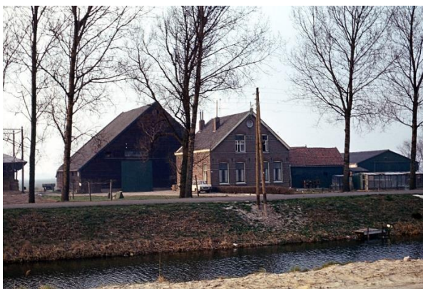
BOERDERIJ PAX

De boerderij waarnaar de wijk is vernoemd werd in 1856 gebouwd op kavel L21 aan de Hoofdweg, waar nu de Florence Nightingale- en Pater Damiaanstraat op de Hoofdweg uitkomen. De boerderij (later genaamd Bakkershoeve) heeft er een halve eeuw gestaan. In november 1907 brak er brand uit in de stal. Deze brandde geheel af, evenals een groot deel van het woonhuis.