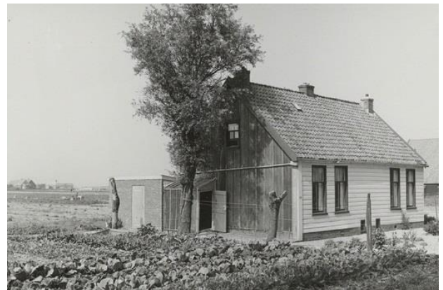
GESLOOPTE WONING HOOFDWEG 765

De dubbele landarbeiderswoningen aan de Hoofdweg 763 en 765 zijn in 1974 afgebroken en de houten “kringenwetwoning” tussen het fort en de witte boerderij is in mei 1976 eveneens voor een oefening in brand gestoken. De twee dubbele woningen aan de Hoofdweg 547-753 zijn bewaard gebleven.