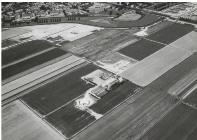
LUCHTFOTO CEBECO BOERDERIJ CA. 1965

Cebeco bestaat overigens nog steeds onder de naam (Cebeco Agro) en is een dochter van de Royal Agrifirm Group. Het bedrijf telt wereldwijd 3.000 werknemers, met het hoofdkantoor in Apeldoorn.