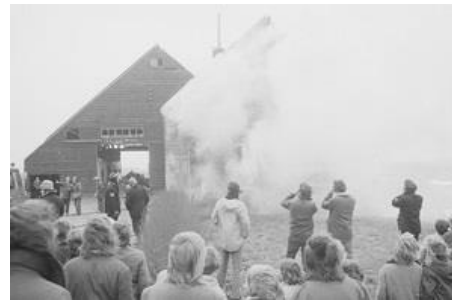
BOERDERIJ PAX IN DE FIK

Het jaar daarop werd de boerderij herbouwd en kreeg hij een nieuwe naam: "Pax". Ook deze boerderij werd door de gemeente gekocht ten behoeve van de te bouwen wijk. Pax stond enkele jaren leeg en werd op 16 maart 1974 in brand gestoken als brandweeroefening.