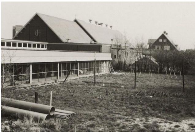
DE CEBECO BOERDERIJ - FOTO NHA

Cebeco bestaat overigens nog steeds onder de naam (Cebeco Agro) en is een dochter van de Royal Agrifirm Group. Het bedrijf telt wereldwijd 3.000 werknemers, met het hoofdkantoor in Apeldoorn.