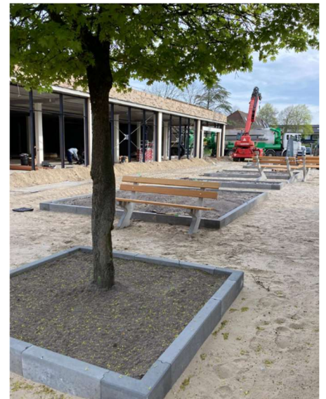
PLEIN VOMAR

en laadruimte, maar dat probleem werd toen apart gezet met de motivatie dat er alleen gekeken werd naar de omvang en de buitenkant van het gebouw.