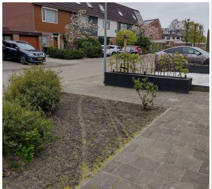
WAAR DE GEMEENTE VOOR VERGROENING HEEFT GEZORGD, ZIJN DE EERSTE SPOREN VAN EEN OLIFANTENPAADJE INMIDDELS ZICHTBAAR.

Uit het onderzoek bleek dat dat gemiddeld tussen de 15 en 17 km per uur is, en dat 85 procent van de automobilisten niet harder dan 20 tot 22 km per uur rijdt. Daarop heeft de gemeente laten weten dat het formeel aanduiden van dat weggedeelte tot woonerf (met een maximum snelheid van 15 km/uur) geen meerwaarde heeft.