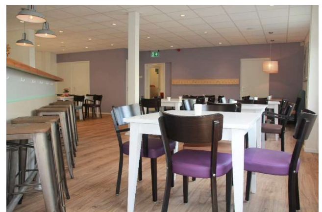
DE HUIDIGE ONTMOETINGSRUIMTE