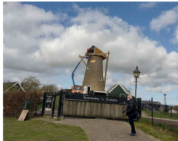
Een ontakelde Eersteling.

wieken te ‘bekleden’ en de molen voor de Nationale Molendagen in het weekend van 11 en 12 mei helemaal klaar te hebben.