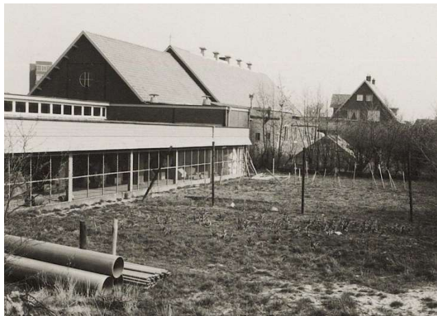
DE CEBECO BOERDERIJ MET BIJGEBOUWEN

Al bij de ontwikkeling van de nieuwbouwwijk Pax was door de gemeente besloten dat de voormalige Cebeco boerderij, inclusief woonhuis en laboratoriumgebouw, niet gesloopt zouden worden maar later gebruikt zouden kunnen worden voor sociaal-culturele doeleinden. Al in 1973 deed de initiatiefgroep Samenlevingsopbouw Haarlemmermeer om de gebouwen te gebruiken voor kinderopvang, speelruimte en ontmoetingsruimte voor praatgroepen en cursussen. De bedrijfsruimte van de boerderij was daarvoor nog ongeschikt maar het laboratoriumgebouw kon al snel in gebruik worden genomen.