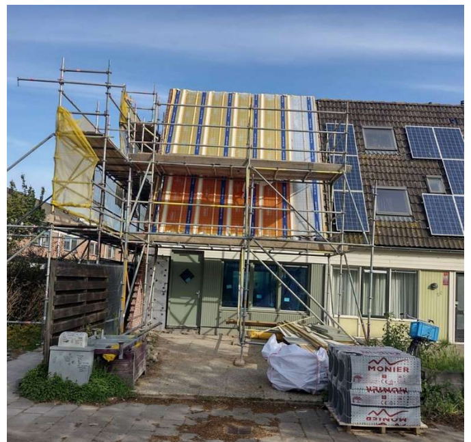
ER WORDT HARD GEWERKT AAN DE MODELWONING

kan worden dat de kozijnen geheel krasvrij worden vervangen. Het project behelst de woningen in de Bernadottestraat 1 t/m 133 en Kelloggstraat 61 t/m 87 oneven.