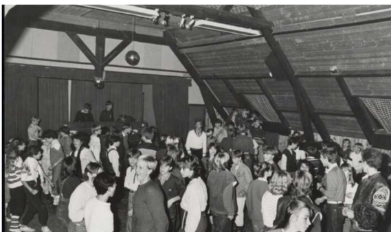
COLA DISCO IN DE BOERDERIJ (NHA)

Door de besparing die daarmee werd bereikt, extra sponsoring en de organisatie van een rommelmarkt werd voldoende geld vrijgemaakt om ook de gewenste lift te kunnen installeren. Op zaterdag 2 september 1978 werd de verbouwde Boerderij geopend met optredens van o.a. Wim Wama, Rita Corita, de Ricardo's en het orkest De Flinstones en werden presentaties gegeven door de toen actieve clubs en verenigingen in Pax. In de Boerderij bruiste het toen van de