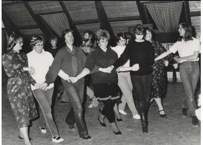
EN VOLKSDANSEN (CA. 1980)

activiteiten: Creatieve- en dansclubs, een coladisco, toneel- en theatervereniging, kaart- en sportclubs zoals tafeltennis en judo. Ook werden er filmvoorstellingen gegeven voor de jeugd en voor volwassenen.