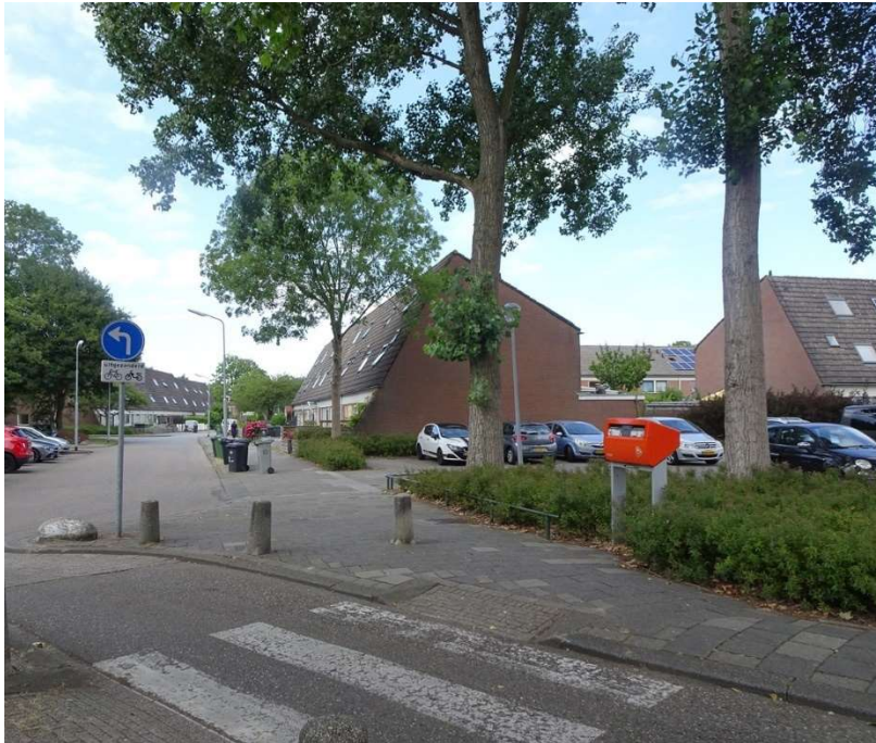
Bezwaar tegen kappen bomen en inrit Vomar