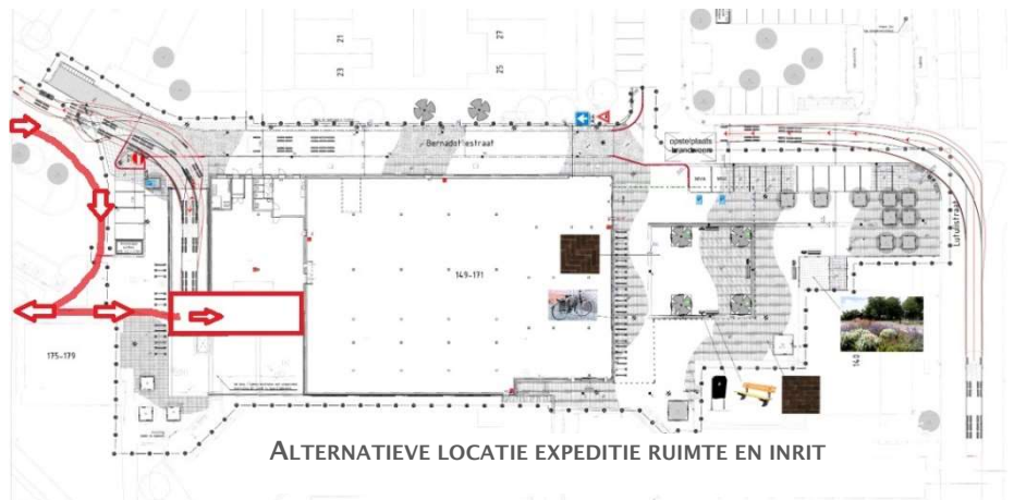
ALTERNATIEVE LOCATIE EXPEDITIE RUIMTE EN INRIT

Over de kansen wie van de twee partijen gelijk krijgt is weinig te zeggen. De twee aanwezige gemeenteraadsleden lieten zich er niet over uit. Een gepensioneerde verkeersdeskundige uit Toolenburg meende dat de nadruk moest komen te liggen op de steeg waardoor de