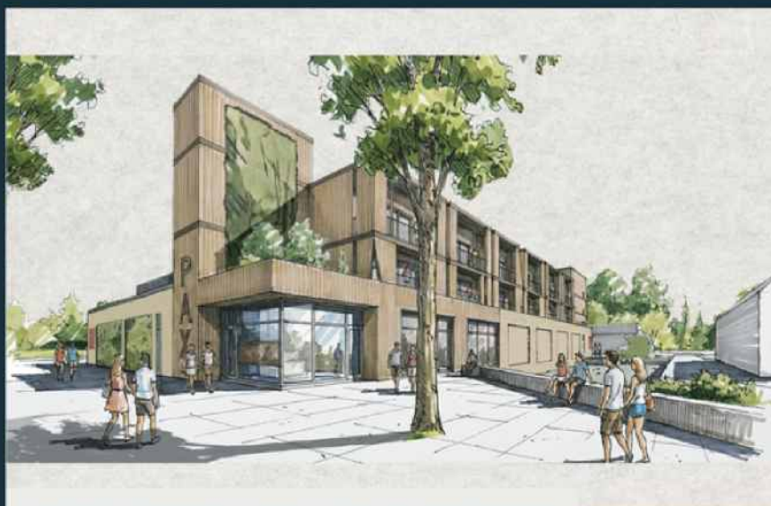
AANZICHT ACHTERKANT VOMAR / ENTREE 30 APPARTEMENTEN

Deze beelden zijn nog in concept. Daarom kunnen hieraan geen rechten worden ontleend.