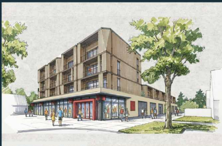
AANZICHT VOORKANT VOMAR